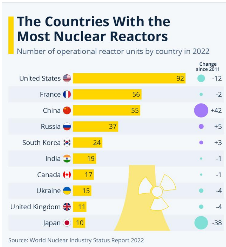
Figura 2- Os países com mais reatores nucleares